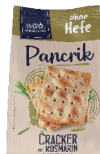
Cracker mit Rosmarin Vegan 2,19 € / 200 g