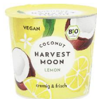
Coconut Lemon, 2,59 € / 275 g