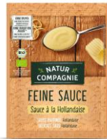
Sauce à la Hollandaise 1,29 € / 23 g