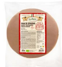
Tortenboden Biskuit 3 Stück 5,99 € / 350 g