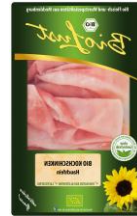
Kochschinken, hauchfein 3,59 € / 80 g