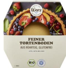
Feiner Tortenboden Glutenfrei 5,95 € / 300 g