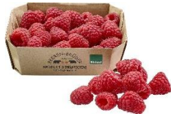
Himbeeren 5,49 € / 1 Schale