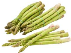
Spargel grün 9,95 € / ca. 500 g