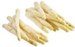
Spargel weiß/violett 9,95 € / ca. 500 g