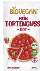
Tortenguss rot 1,29 € / 2 x 7 g