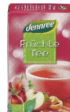
Früchtetee 1,79 € / 20 Btl.