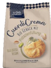
Gebäck mit Pistazienfüllung Vegan 3,49 € / 200 g