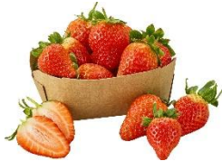
Erdbeeren 6,79 € / 300 g